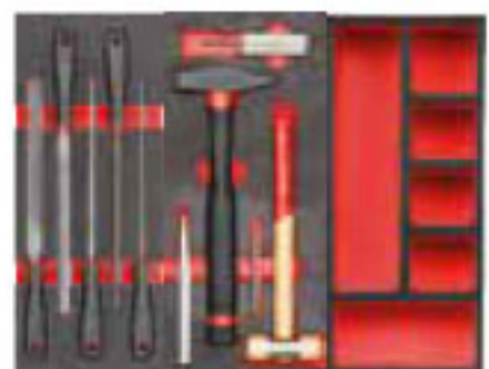
519 M 990A5B 519 M 382 519 MSK6