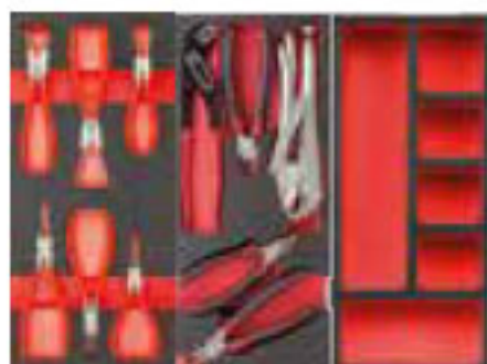
519 M 127C 519 M 150AX 519 MSK6