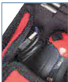
Tasca interna per il cavo USB-C