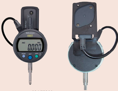
02AZE200 Supporto per U-WAVE-T per comparatori, calibri in fibra di carbonio