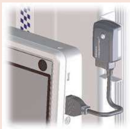
02AZE200 Supporto per U-WAVE-T per QM-Height