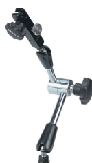
011361 Blocco meccanico Dimensioni : vedi 011358