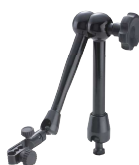
56AAK793 Blocco meccanico Dimensioni : vedi 7033B