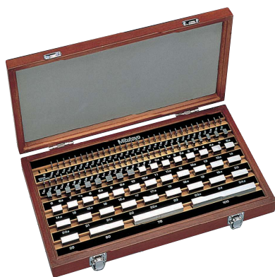
Set 112 pezzi in acciaio