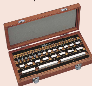
Set 47 pezzi in acciaio