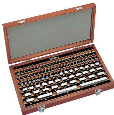
Set 103 pezzi in acciaio