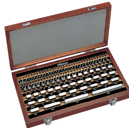
Set 112 pezzi in acciaio