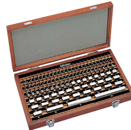
Set 103 pezzi in acciaio