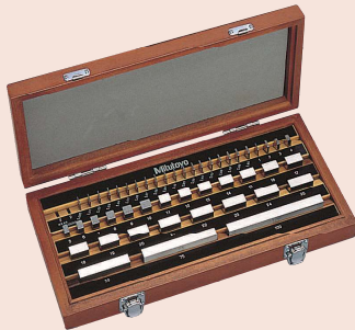
Set 47 pezzi in acciaio