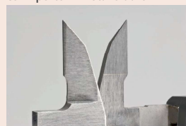
505-735 Becchi per interni ed esterni con riporto in metallo duro