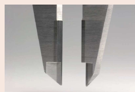
505-734 Becchi per esterni con riporto in metallo duro