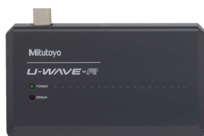
02AZD810D U-WAVE-R (ricevitore)