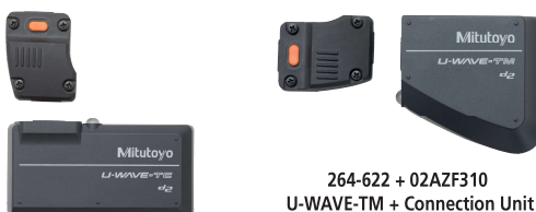
264-622 + 02AZF310 U-WAVE-TM + Connection Unit