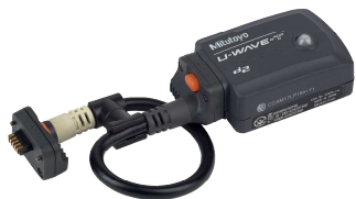
02AZD730G + 02AZD790A U-WAVE-T e cavo di collegamento

U-WAVE-T e U-WAVE-TC / TM (U-WAVE fit) - sistema di trasmissione dati senza fili