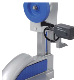
Applicazione con truschino