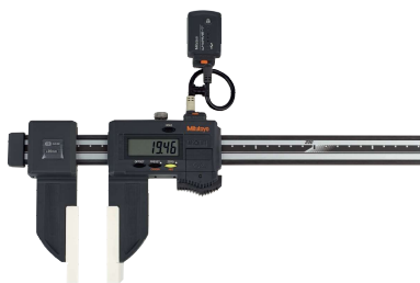
Applicazione con calibro in fibra di carbonio

(Cavi di connessione, vedi pagina seguente)