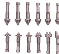
Caprugini intercambiabili (a coppie)