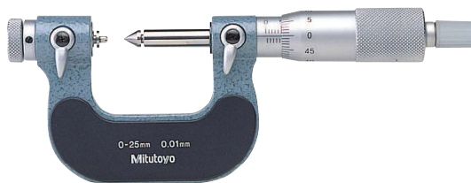
126-125 con accessori opzionali